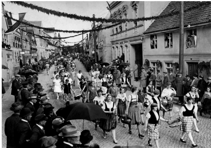
Szene aus dem Festumzug 1927

Und gefeiert soll werden, eigentlich das ganze Jubiläumsjahr hindurch, ganz besonders aber zu Pfingsten. Um dieses Fest ordentlich vorzubereiten, hat sich in Friesack ein Festkomitee gegründet, in welchem neben dem Bürgermeister und Abgeordnete der Stadtverordnetenversammlung auch interessierte Bürger mitwirken.