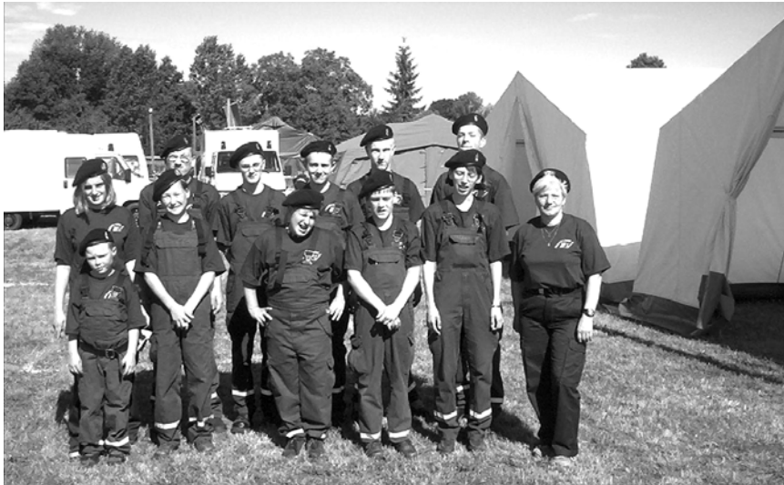
Im Kreisausbildungslager Zootzen Damm