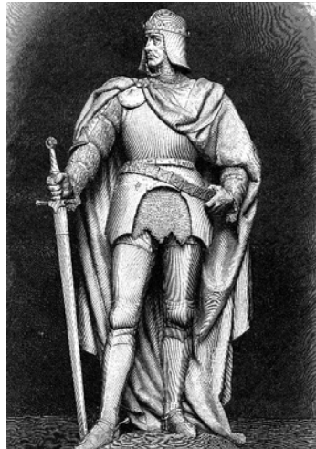
Denkmalfigur Friedrich I.

schließlich zur offenen Konfrontation. Am 6. Februar begann vom Mühlenberg her