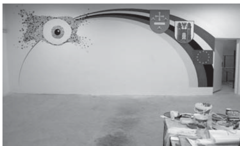
Das gemeinsam gestaltete Wandbild

einem Auslandspraktikum anzuwenden, zu erproben und zu verbessern. Damit wurden die