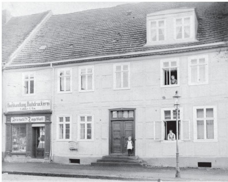
Das „Stammhaus“ des Friesacker Tageblatts.

Mai 1927 zur Sechshundertjahrfeier von Friesack beinhaltet eine aufschlußreiche Chronik der Stadt. In den älteren Ausgaben fand das Geschehen aus der näheren Umgebung einen breiten Raum, besonders im Annoncenteil.