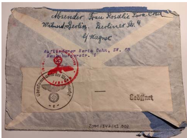
Rückseite eines Briefes von Rosalie an ihre Töchter

Im Jahr 1939 gelang ihren beiden anderen Töchtern, teils unter dramatischen Bedingungen, die